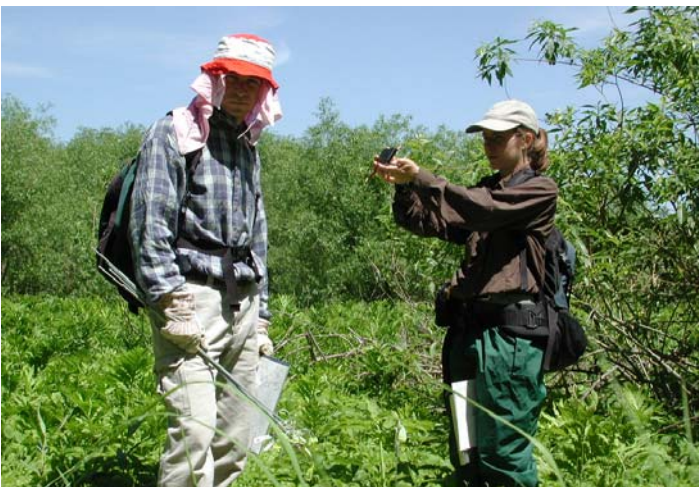
Vous voyez ici à l'œuvre une des équipes ayant participé aux travaux de terrain

Rappelons que les objectifs du plan de conservation de l'arisème dragon sont les suivants : assurer la protection des populations de bonne qualité, valoriser l'arisème dragon auprès des communautés locales, assurer le maintien de l'arisème dans l'ensemble de son aire de répartition au Québec et améliorer la situation dans la région métropolitaine. Les riverains ont été, grâce au projet, sensibilisés à la richesse du fleuve Saint-Laurent et à la fragilité des habitats humides, entre autre par le biais de panneaux d'interprétation sur les espèces menacées. Plusieurs organismes de conservation se sont impliqués dans le suivi des populations d'arisème recensées, ce qui nous permettra de mieux connaître les menaces qui pourraient peser sur les populations et d'envisager des solutions efficaces.